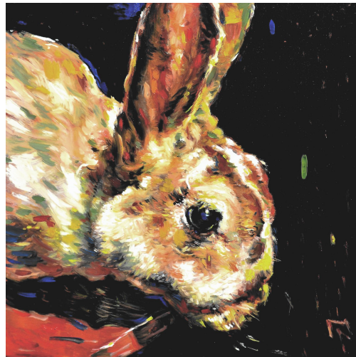
Lapin d'Alice Huile sur toile, série Animaux fond noir