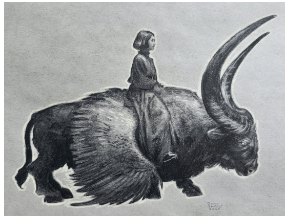
Fillette sur Bison