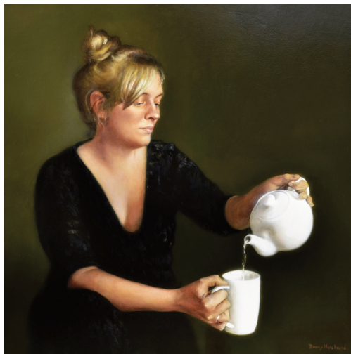
Moment Muet Glacis à l'huile, 2015